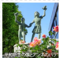
平和祈念の像とアンネのハラ