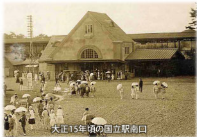
大正15年頃の国立駅南口