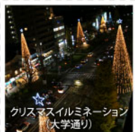
クリスマスイルミネーション (大学通り)