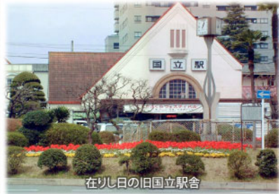
在りし日の旧国立駅舎