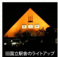
旧国立駅舎のライトアップ