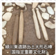
緑川奥遺跡出土大形石棒 ・(国指定重要文化財)