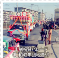
雨の日探検パレード (昭和42年団地通り)