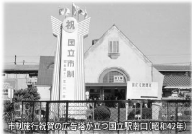
市制施行祝賀の広告塔が立つ国立駅南口(昭和42年)