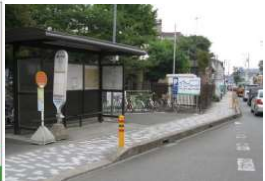
茅ヶ崎市鶴嶺小学校前バス停