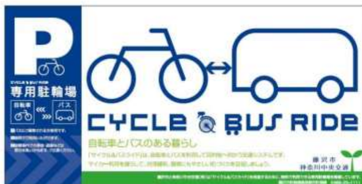
サイクルアンドバスライドの看板