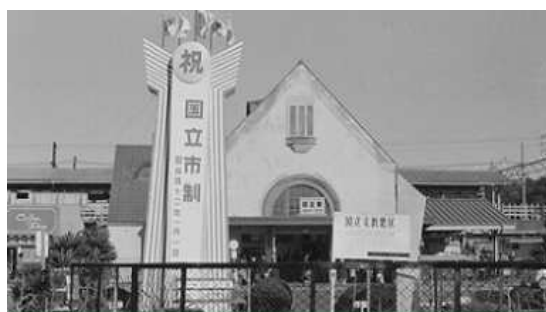
市制施行時（昭和42年）の国立駅前