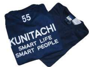
記念品のオリジナルTシャツ (速乾性スポーツ用)

6. 申込 電話またはファクスまたはメールで担当係へ 事前にお申し込みください。