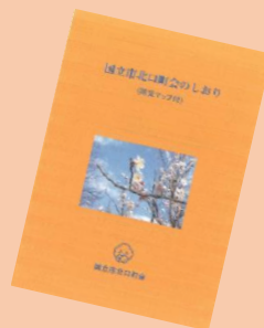
▶国立市北口町会のしおり

また、都宝くじ助成金にて倉庫やテント、餅つきセットなど購入し、餅つき大会の定期化、特に平成25年餅つき大会時は見守りマップ指導いただきました福祉部局の職員の方にも参加いただきお披露目ことができました。