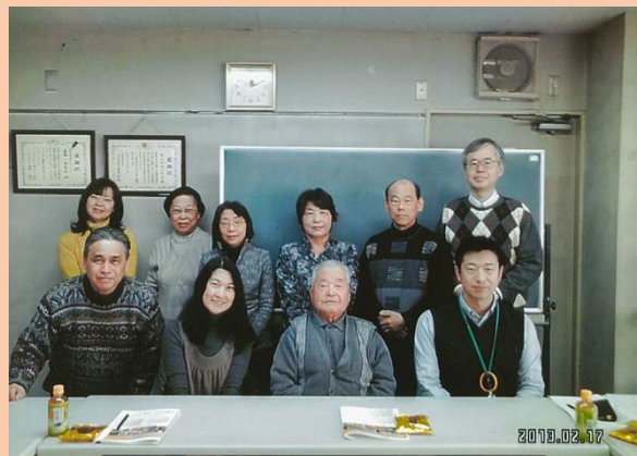
▲北口1丁目お役に立ちます見守りマップ実行委員会