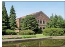
兼松講堂 昭和2年建設。兼松商店の寄付による今も現役のホールです。