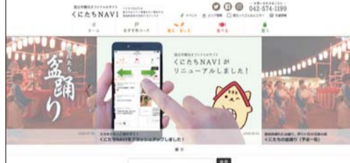
▲「くにたちNAVI」のトップページ。

「くにたちNAVI」 くにたち観光情報サイト くにたちNAVIは、市内で開催されるイベントや観光スポットなどのおすすめ情報を日々発信する地域密着型のウェブマガジンです。スマートフォンにも対応し、市内を散策しながら手軽に検索ができます。 トップページには、インスタグラムを利用した市内の画像を掲載し、最新のくにたちを楽しむことなどもお知らせしています。ほかにも、C.I.L.K.にたち援助センターとの連動企画として、お手伝いが頼めたり、さまざまなしょうがいのある方でも気軽に立ち寄れるお店など、だれもが集える場所の情報も紹介しています。また、市内や近隣市の事業者と協同し、就労に役立つ求人情報サービス「くにたち地域おしごと情報」も運用しています(運用は国立市)。 企業や商品のPRができるバナー広告も募集していますので、ぜひ、ご活用ください。 問 国立市観光まちづくり協会 ☎(574)1199 「国立ショッピング情報」 くにたちのお店情報サイト 現在、市内の約800店舗を掲載しています。本年4月にホームページをリニューアルし、より便利で使いやすいになりました。また、スマートフォンにも対応できるように見やすく使いやすいデザインになっています。 リニューアル後は、キーワード検索機能を追加し、名前はわからないけれど、気になっているお店などを調べるときに便利です。店名のほか、キーワード検索システムを導入したことで、さまざまなニーズに対応可能となりました。さらに、ホームページのトップページには、更新された情報をピックアップとして画像を掲載するとともに、各店がSNSで発信する最新情報も交えて紹介しています。くにたちのお店の多種多様な情報を随時配信しているので、今までも気づかなかった新たな発見があるかも知れません。 ぜひ、お気に入り追加して、ご活用ください。 問 国立市商工会 ☎(574)1000