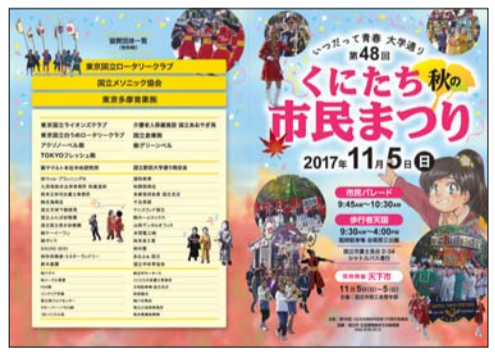
▲昨年の市民まつりのポスター。

第49回くにたち秋の市民まつり実行委員会では、すでにチラシやホームページにてお知らせのとおり、11月4日(日)開催予定の「第49回くにたち秋の市民まつり」のポスターデザインを募集しています。応募いただいた作品のうち、ポスターに採用された作品の作者の方には、実行委員会からプレゼントを差し上げます。 応募規定 ■未発表のオリジナルイラストであること ■作品はカラー、A3判 ■縦位置の絵画で制作していること ■デジタル、クレヨン、色鉛筆、水彩、油彩など、作画方法は自由 ■投稿作品の著作権は投稿者に帰属しますが、ポスターに採用された作品の著作権は「第49回くにたち秋の市民まつり実行委員会」に帰属し、改変、編集する場合があります ■応募作品は返却しません ■応募方法 9月14日(金)までに、郵送または直接問へご提出ください。 問 〒186-8501 富士見台2-47-1 1 第49回くにたち秋の市民まつり実行委員会事務局(市役所まちの振興課内)