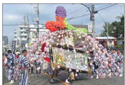
▲市内を練り歩く花万灯。

9月23日(日・祝)午後は「くにたち」バス北西中ルートの一部が迂回運行になります 谷保天満宮例大祭開催に伴い、次のバス停が利用できません。ご迷惑をおかけしますが、ご理解ご協力をお願いします。 ■「くにたち」北西中ルート 国立市役所方面行き 国立西郵政宿舎、ふれあい公園入口、中一丁目、国立公民館、国立学園、音高、ぶどう園西、学園通り ■「くにたち」北西中ルート 国立駅北口方面行き ぶどう園東、中防災センター入口、国立学園、国立公民館、音大附属小学校東、音大附属小学校北、西一丁目交差点 ※富士見通り・旭通りを運行する路線バスの一部も、迂回運行やバス停の休止がありますので、ご注意ください。 問 道路交通課交通係