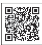
「国立ショッピング情報」のQRコード。