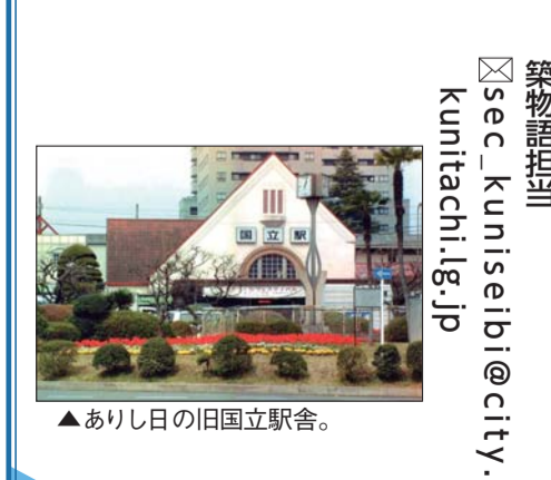
▲ありし日の旧国立駅舎。

夕涼み (ミネッキーさん) 今から五十数年前の夏の夕暮れ。私は両親に手を引かれ夕涼みに出かけました。場所は国立駅前の円形公園。 円形公園の駅側にベンチが一つ置いてあり両親はそこに座っていました。そして、ロータリーをたまたま通り過ぎる自動車を眺めていました。「あっ、また来た!」大学通りから、こちらに向かっている自動車のライトを見つけた私は、そう叫びました。 あなたの旧国立駅舎の思い出を市報に掲載しませんか 申込 旧国立駅舎の思い出を200字程度でまとめ(様式自由)、掲載する際の題名および作者名としてペンネームやイニシャルなどを明記のうえ、郵送、ファクス、メールまたは直接問へご提出ください。選考のうえ、市報で紹介させていただきます。 問 〒186-8501 富士見台2-47-1 国立駅周辺整備課旧国立駅舎再築物語担当 ✉ sec_kuniseibi@city.kunitachi.lg.jp