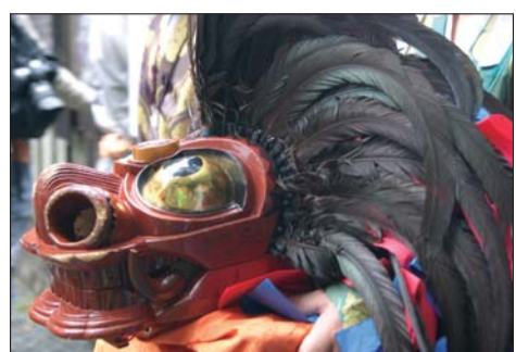
▲古式獅子舞で使用する獅子頭。

学業成就や交通安全のご利益で知られる市内の谷保天満宮で、例大祭が開催されます。開催期間中は、1千年以上の歴史を誇り、国立市無形民俗文化財に指定されている古式獅子舞の披露や、万灯行列などが盛大に執り行われます。各町内会も多数参加し、多くの方々にぎわう、くにたちの伝統的な祭典です。ぜひ、お越しください。 9月22日(土) ■午後8時〜宵宮祭り ※各町内会が提灯を持って、谷保天満宮をめざす行列です。 ■終了後…古式獅子舞披露 9月23日(日・祝) ■正午〜万灯行列 ※各町内会や子どもたちが花万灯を持ち、JR谷保駅ロータリー(谷保天満宮を勇壮に練り歩き、獅子舞行列を先導します)。 ■午後3時ごろ〜古式獅子舞披露 9月25日(火) ■午前10時〜例祭祭典 問 谷保天満宮(谷保5209) ☎(576)5123 HP http://www.yabotemangu.or.jp/index.html