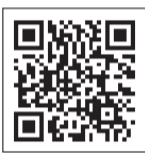
「くにたちNAVI」のQRコード。