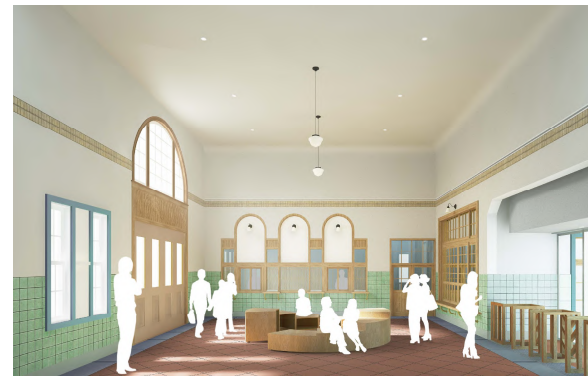
多目的室（広間）の内観図（イメージ）