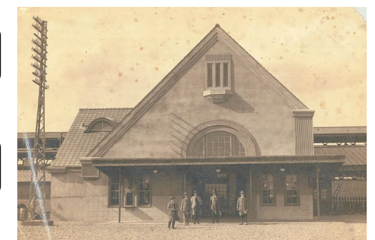
創建当時の旧国立駅舎