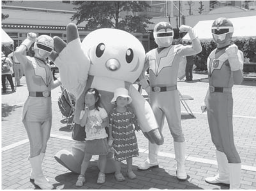
たまご広場でヒーローたちと

の他、ウエイトリフティングのデモンストレーションにも挑戦。多くの皆さんに会場に足を運んでいただけるよう、はりきってがんばっています。これからもどんどん出動していきますので、よろしくお願いいたします。