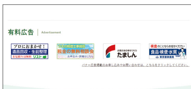
▲市ホームページへの広告掲載例。