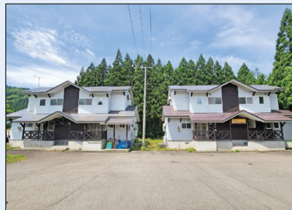
▲移住定住促進住宅。

環 北 秋 田 市 総 合 政 策 課 政 策 係 TEL 0186-62-6606