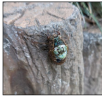
▲ミンミンゼミ(羽化)。