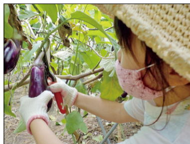
▲採りたてのおいしい秋ナスを楽しんでみませんか?