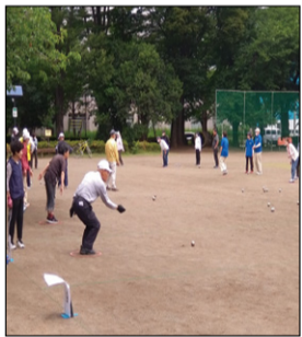
▲健康スポーツ「パタンク」の様子。