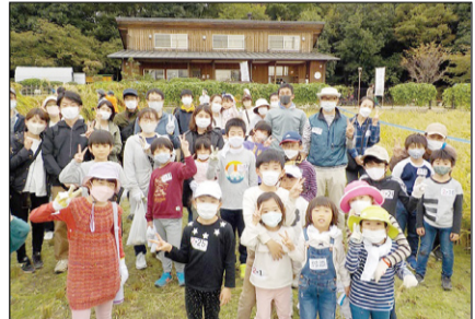
▲昨年度の「稲刈り」体験後の様子。

※駐車場はありません。 定 50名程度(申込多数時抽選) ¥1人1,000円(当日集金) ※小学生以下は大人の付き添い(参加費無料)が必要です。 申・問 10月2日(月)(必着)までに、①「わくわく稲作体験(稲刈り)」②参加可能な時間帯が限られている方は1部か2部を選択③体験希望者の氏名と年齢(付き添いがあればその方の氏名と年齢も)④住所⑤電話番号⑥メールアドレスまたはファクス番号を明記し、城山さとのいえ ☎satonioie@city.kunitachi.lg.jp ☎505-5190までメールまたはファクスにて