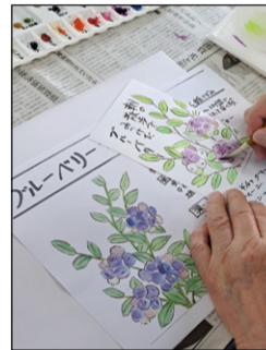
▲絵手紙制作の様子。

申・回 社会福祉協議会地域生活支援課地域福祉係 場 サロン・ド・デイホーム 回 580-1296まで電話のうえ、 回 の窓口にて受付 ※体験参加も受け付けています。お気軽にお問い合わせください。