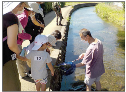
▲お米やささまざまな生き物を育て、きれいな農業用水の大切さを体感しましょう。

申・問 9月18日(月)(必着)までに、①「わくわく農業用水探検」②参加者の氏名と年齢(付き添いがあればその方の氏名と年齢も)③代表者住所④電話番号⑤メールアドレスまたはファクス番号⑥イベント共済保険加入希望の有無を明記し、城山さとのいえ ☎satonioie@city.kunitachi.lg.jp ☎505-5190までメールまたはファクスにて