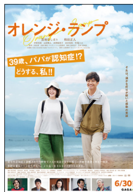
▲「オレンジ・ランプ」ポスター。

申10月5日(木)より、国立市在宅療養推進連絡協議会事務局 ☎569-6213(午前9時～正午)まで電話