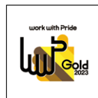
▲「ゴールド」認定ロゴ。