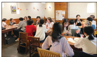
▲10月に開催したグローバルカフェの様子。