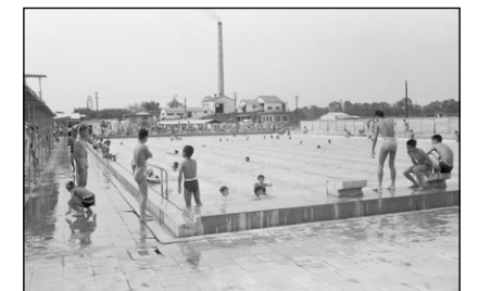
完成した清化園50mプール(1962(昭和37)年7月頃)。