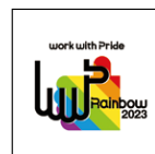
▲「レインボー」認定ロゴ。