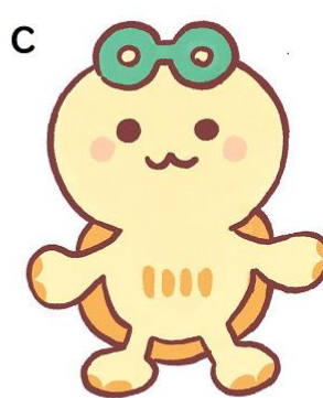
C案：さんぽをしながらごみ拾いをするのが日課のカメ おしゃれとしてメガネをかけている