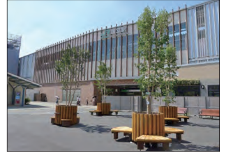
▲旧国立駅舎東側広場。