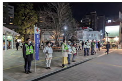
▲1月18日の募金活動の様子。