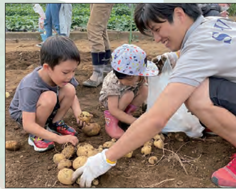
昨年イベントの様子▶