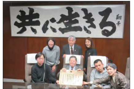
▲永見市長と国立五日制の会の皆さま。