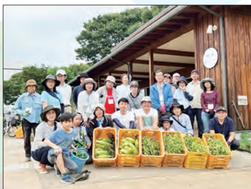
昨年イベントの様子▶