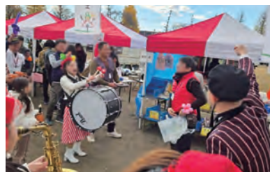
▲去年の演奏の様子。