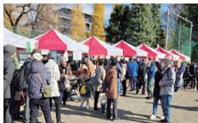
▲去年の出店の様子。