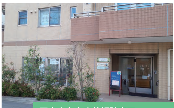
国立市在宅療養相談窓口 場 富士見台4-10-1 TEL 569-6213