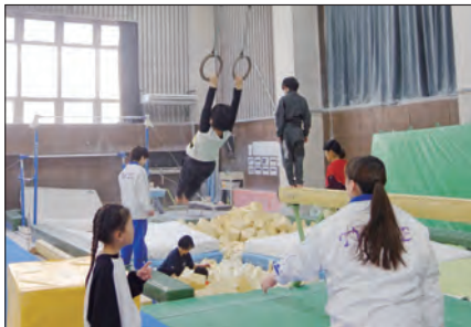
▲令和6年度スポーツ子どもの日の様子。

申 2月19日(木)(必着)までに、④まで郵送または申込フォーム(1名ずつ申込)より