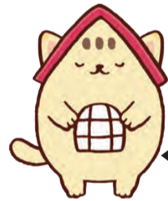
くにニヤン。

市民サービスへの影響(約9割の方が午前9時~午後4時に来庁していること)を踏まえ、受付時間の見直しを行います。また、市民の利便性向上と行政運営の効率化を図るための取り組みを推進します。ご理解・ご協力をお願いします。