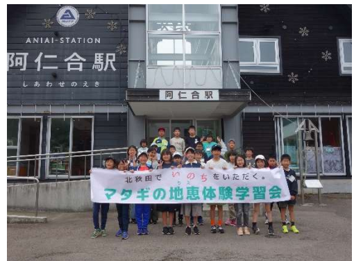
▲昨年度の体験学習の様子。