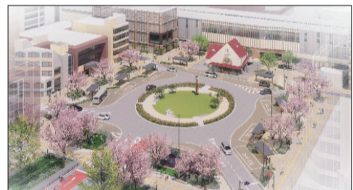
▲整備後の国立駅南口駅前広場のイメージ。

A.矢川通りやJR国立駅前周辺などは、スペースが狭いことから交通への影響が大きく、支柱等の対応は難しいですが、大学通りでは個別の樹木ごとに伐採以外の維持方法の可能性も検討していきます。