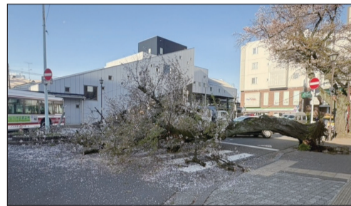
▲JR矢川駅北口駅前広場で倒木した桜(B2判定)。

また6月末までに、JR国立駅前や矢川通り、谷保第四・五公園などで大きな落枝も発生しています。