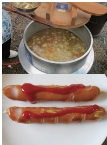
おいしい出店 (豚汁・フランクフルト等)