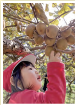
「初めてのクワイ狩り」 ごきげんカレー 様