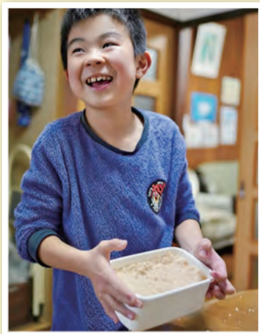
「食べることは生きること」 kuriayano25 様