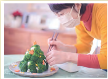
「ブロッコリーの大変身」 miu 様