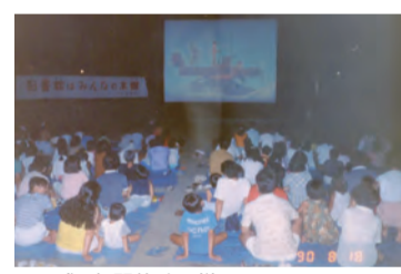
▲平成2年開催時の様子。