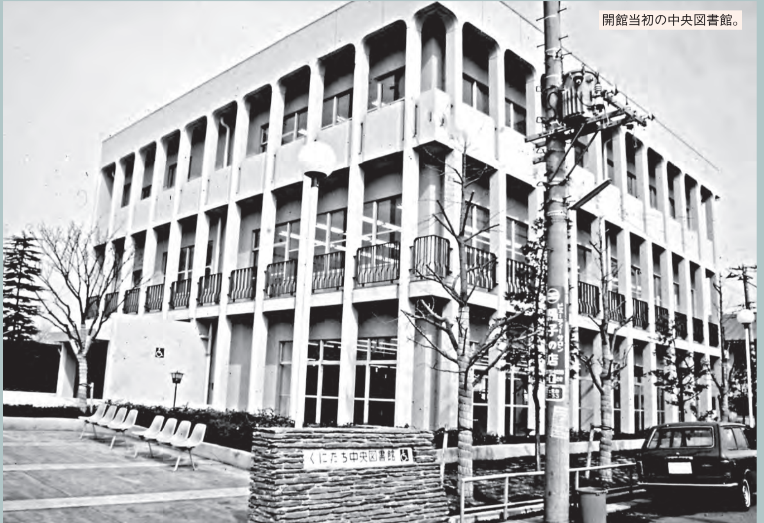
開館当初の中央図書館。