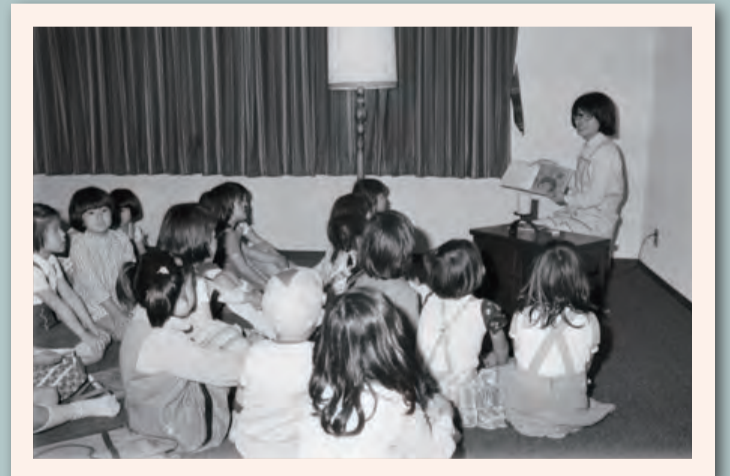
▲開館当初から実施している「おはなしのじかん」。