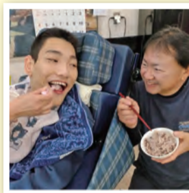
「待ちどおしい給食の時間」 くにたち社協・障害者センター &あすなる 様