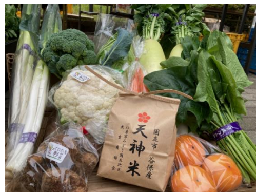
▲写真はイメージです。