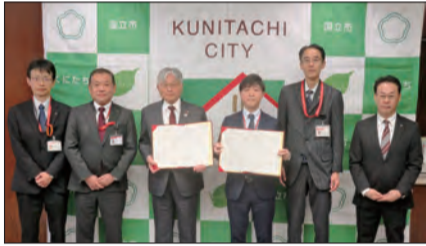
▲協定締結式の様子。

日本郵便株式会社とは、これまで災害時における相互協力、道路の危険箇所や不法投棄の情報提供、地域における見守り活動に関して協定を締結し、相互に協力をしてきました。このたびの包括連携協定の締結