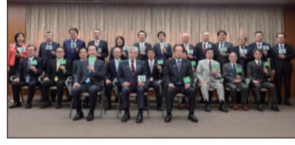
▲多摩地域26市長の集合写真。

多摩地域26市は、東京都多摩地域共同でネットワークを形成し、平和首長会議の「持続可能な世界に向けた平和的変革のためのビジョン」のなかで掲げている「平和文化の振興」に向