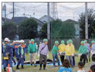
▲自主防災組織による救助訓練。

地震などの災害による被害を軽減するためには、地域ぐるみの初期消火や救出・救護活動などの「共助」が効果的です。地域の防災訓練や避難所運営訓練、自主防災組織の活動に参加して、地域の防災力向上に努めましょう。