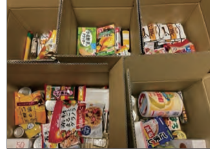
▲お寄せいただいた食品の一部。

フードドライブとは、家庭で余っている食べ物を集めて、地域の福祉団体などへ寄付することです。 7月5日~8月18日にフードドライブを実施し、延べ30名から、計261点、約138kgの食品をお寄せいただきました。 いただいた食品は、市内の施設や子ども食堂などにお届けしました。食品をお寄せいただいた皆さま、ご協力ありがとうございました! 問 ごみ減量課清掃係 問576-2119