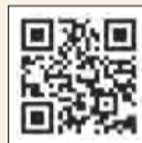
受験生チャレンジ支援貸付事業サイト。

※世帯人数とは、父母等養育者と就学中、未就学、今年度受験予定の浪人生、傷病やしょうがいの理由で就学・就労が困難なことが確認できる等の子どもの人数を指します。