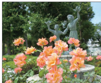
◀市役所西側広場の平和祈念の像とアンネのバラ。