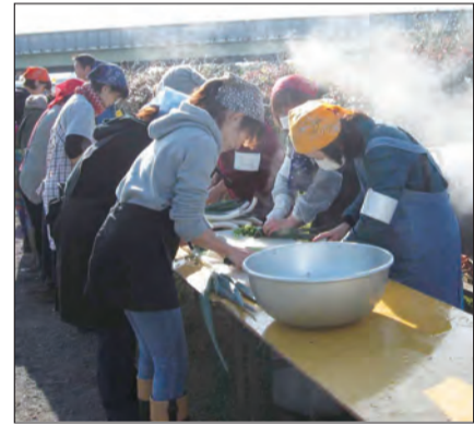
▲過去の手づくりうどん昼食会の様子。

自然豊かな多摩川は、多くの市民の「憩いの場」です。しかし、空き缶やペットボトル、粗大ごみなどの「ごみ」が捨てられるなど、環境問題が生じています。 そこで、多摩川の豊かな自然や景観を守るために、市内の各団体が協力し、多摩川河川敷公園を清掃します。団体に限らず個人での参加も歓迎します。ぜひ、ご参加ください。 清掃に先立ち、自然観察会(野鳥観察)を行います。また、手づくりうどん昼食会(無料)も復活します。清掃後、手づくりうどんを味わいましょう。食器(大きめの丼)・お箸を持参してください。 日 11月19日(日) ▶自然観察会(野鳥観察):午前8時30分~9時40分 ▶清掃活動:午前10時~正午 ※清掃活動の範囲は、石田大橋から上流の野球場付近までです。 ※清掃用具は、主催者が用意します。 ▶手づくりうどん昼食会:正午(清掃活動終了後)~ 場 多摩川河川敷公園 主催 クリーン多摩川国立実行委員会 後援 国立市、国立市美化推進協議会 問 ごみ減量課清掃係 問576-2119