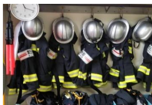
たいがふく 耐火服がいっぱい！