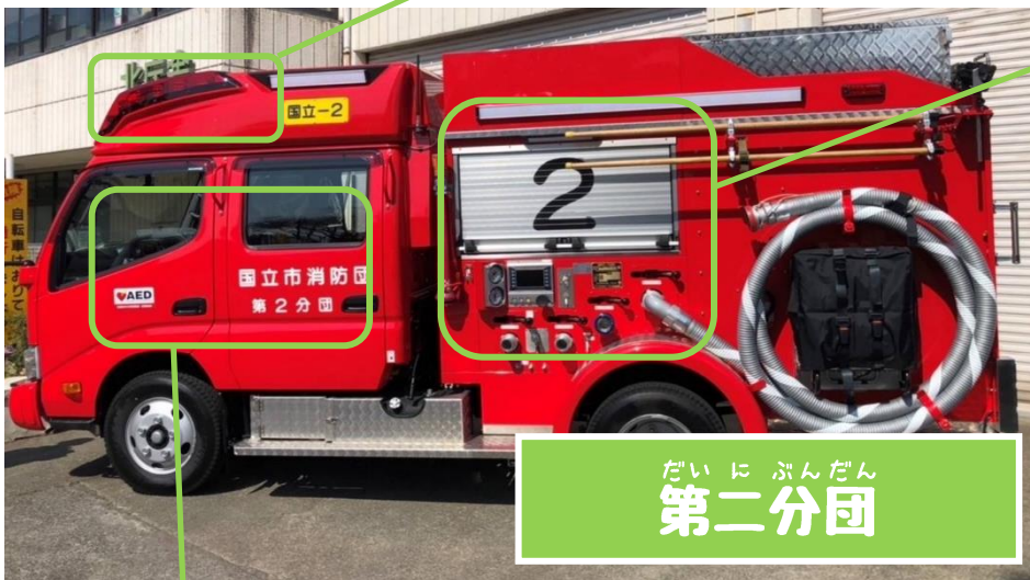
だい に ぶんだん 第二分団