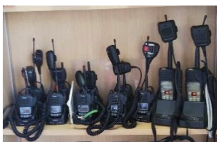
むせんき れんらく 無線機で連絡するよ