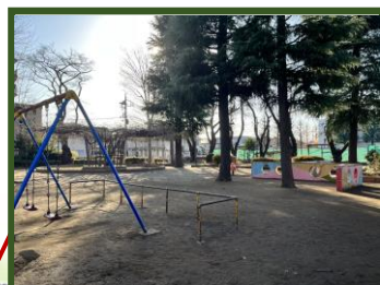
[谷保第三公園] 富士見台2-34