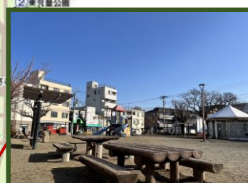
[谷保第一公園] 富士見台1-9