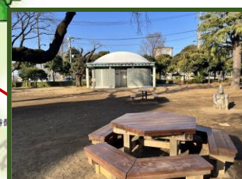
[谷保第四公園] 富士見台2-49