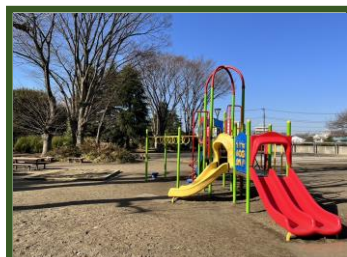
[矢川上公園] 富士見台4-4