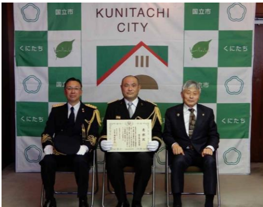
▲左から、清水消防総監、北島団長、永見市長

国立市では、令和4年12月18日に、市内における「火災による死者ゼロ4000日」を達成し、東京消防庁消防総監から表彰状が授与されました。