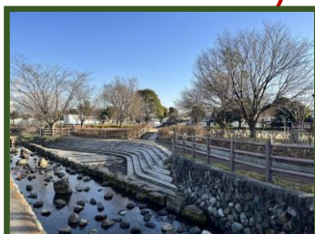
[寺之下親水公園] 泉4-9