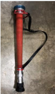
筒先 〔ガンタイプノズル〕