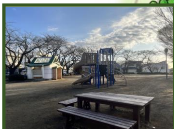
[谷保第六公園] 富士見台3-20