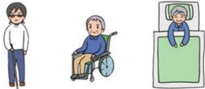
みずか ひなん こんなん かた ※自ら避難することが困難な方

しゃかいふくしせつにゆうしよしゃ かた しせつかんりしゃ たいおう (社会福祉施設入所者などの方は施設管理者の対応となります。)