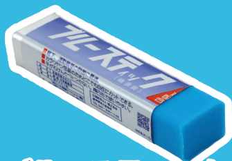
ブルースティック