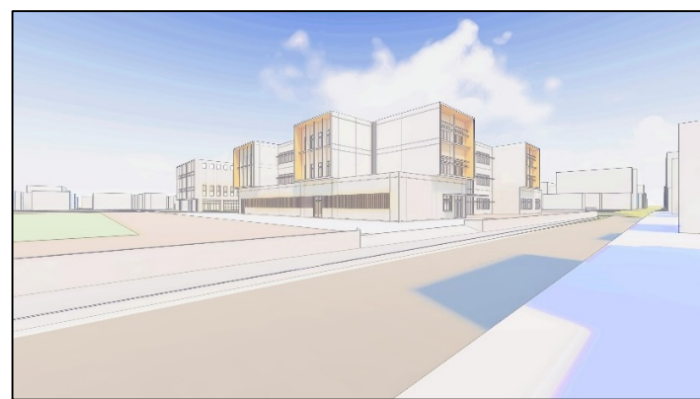
①校舎棟南西側立面(イメージ)