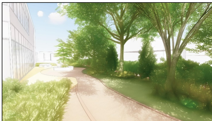
④東広場散策路(イメージ)