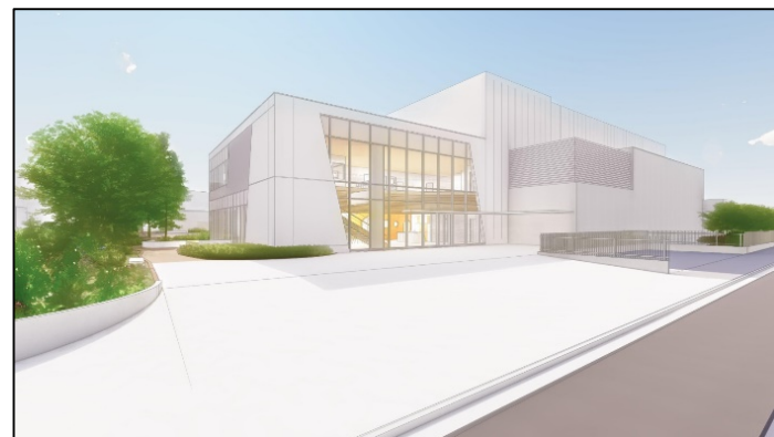
③東広場北側入口(イメージ)