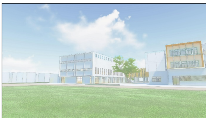
②校舎棟・体育館棟西側立面(イメージ)