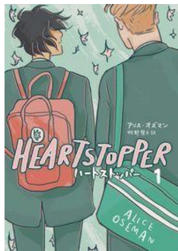
▲アリス・オズマン著 (株)トゥーヴァージンズ発行。

申込 問い合わせ先まで電話または問い合わせ先ホームページよりお申し込みください。