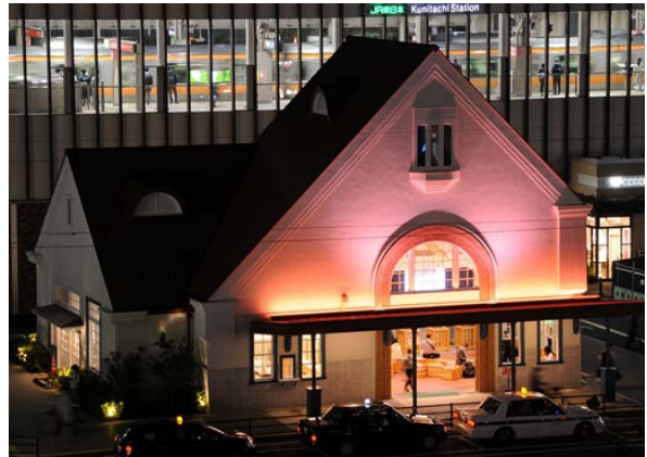
▲オレンジ色にライトアップをした旧国立駅舎。