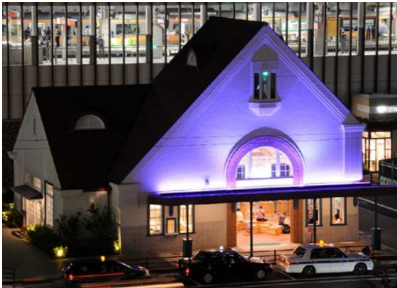
▲紫色にライトアップをした旧国立駅舎。