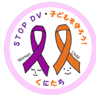
▲ダブルリボンキャンペーンのマーク。

一人でも多くの方にDVと児童虐待の問題を認識していただきたく、ぜひ、貴媒体での告知および取材・掲載方、お願いいたします。