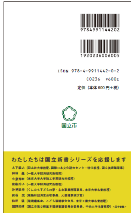
国立新書創刊準備号の表紙(左)と裏表紙(右)。