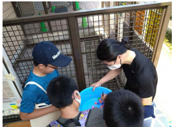
▲スタンプ設置場所（中央児童館）