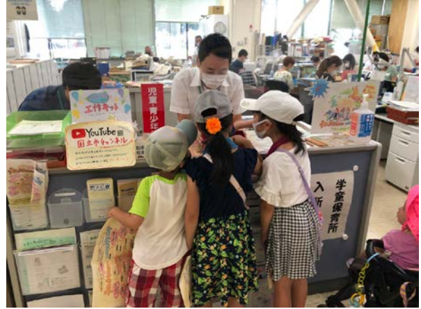
▲スタンプ設置場所（国立市役所児童青少年課）▲