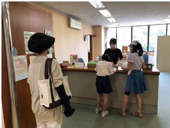
▲スタンプ設置場所（国立市役所市長室）