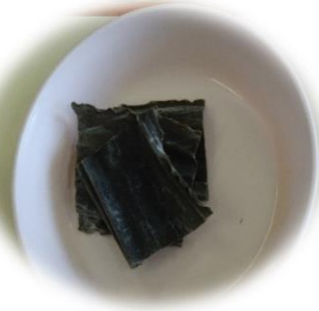
昆布 水につけると 大きくなります。