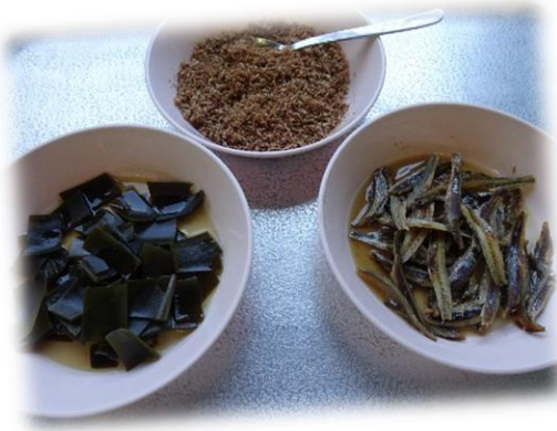
だしを取った後の昆布、煮干しは煮て… かつお節はふりかけにして おいしく食べました！