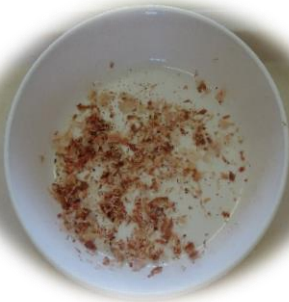
かつお節 削りたてでいい匂い！