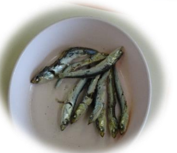
煮干し はらわたと頭を取り、水 から煮ます。