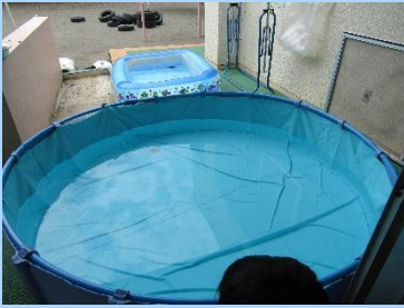
たんぽぽ組プール