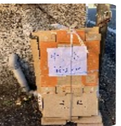
段ボールに会員様から感謝のお言葉

令和4年1月に国会中の会として団体登録をし、毎月の資源物回収をはじめから、早や2年を迎えようとしています。皆様の中に毎月第1土曜日の回収日が定着してきて、大変うれしく思います。この活動による国立市資源回収推進奨励金は令和5年の二つの夏祭り(国立第二小学校と駅前盆踊り大会)の一部に充てることができました。ここで、令和5年の結果を振り返ってみます。表をご覧くださいと、やや減少部分も見受けられます。今後の参考にし、益々のご協力をお願い致します。