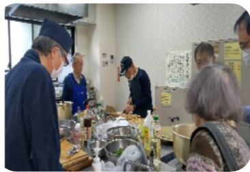
これぞ おとこの台所

なお、<おとこの台所> 申し込みにつきましては、4ページの中の会 カレンダーに記載しています。