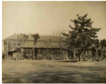
谷保国民学校(現国立第一小学校) 1943年(昭和18年)頃

11月7日(火)、くにたち郷土文化館で、常設展示の他、秋季企画展「くにたちの小学校」を竹内学芸員の説明のもと、参加者6名は興味深く学びました。明治初期の新しい教育制度に基づいて三校あった私塾の内の潤沢学舎が現在の一小として開校したこと、その後公立8校、私立3校が次々に開校した歴史を聞きながら、当時の教科書・卒業証書・文房具・机などの展示物を見ました。常設展では、国立には弥生時代の遺跡が発掘されていないということに興味津々でした。その後、落ち葉を踏みながら古民家まで歩き、懐かしい生活を感じた一日となりました。