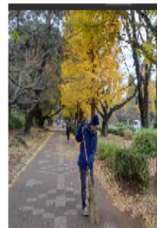
銀杏を愛でながら

11月の清掃活動は、市のごみゼロ運動と連携して開催されました。微かな霧雨交じりの寒い朝でしたが、国立の他地区からも大勢集まり、市長の挨拶や道具の支給等、いつもと違う特別感を感じながら参加しました。