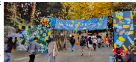
一橋祭 ゴミゼロの日