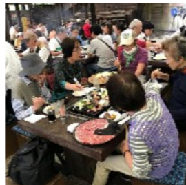
皆でバーベキュー

東の会・中の会(国会連合会)の日帰りバス旅行が、10月10日(火)に実施されました。中の会からは25名が参加され、秋本番の秩父路を巡る楽しい一日となりました。バスは午前7時50分に国立を出発し、花園インターを下車して、埼玉県立「川の博物館」に到着。到着時には青空も広がり、直径24.2メートルの日本一の大水車が迎えてくれました。記念撮影後、館内を見学、荒川の上流から下流までの全てが分かるように、最新の展示機器、映像等が駆使されており、充実した時間を過ごすことが出来ました。次は昼食会場へ移動、長瀬のバーベキュー場「古沢園」で昼食、牛肉・豚肉・野菜・おにぎりをお腹一杯、食しました。