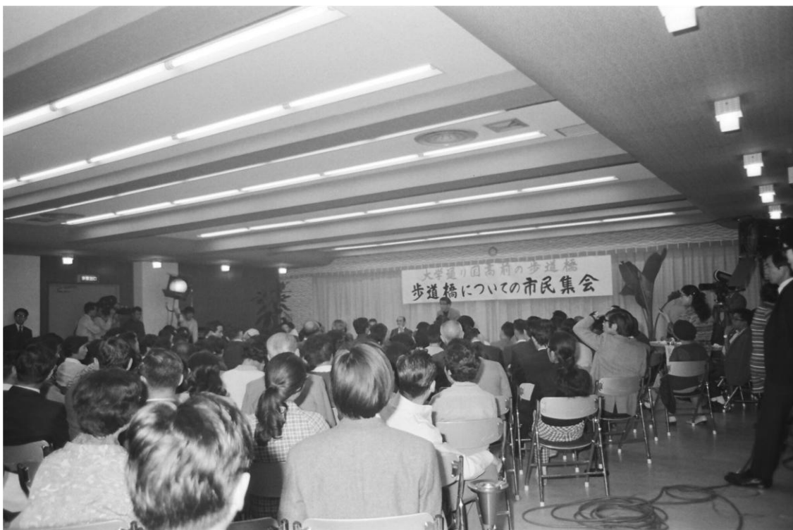
歩道橋設置の是非を問う市民集会

ところが、富士見台団地が完成すると大学通りを始め街全体の交通量が増えて、朝、子供たちが、なかなか大学通りを渡れない状況が出てきた。私たち PTA は朝、大学通りの桐朋側に立ち子供たちに黄色の旗を持たせて渡らせるという手助けをし、その旗は国高側の道路筋の籠に置かれ、帰路は先生方が途中まで送ってくださり、一人ひとりに旗を持たせて横断させるという活動が続いたのである。この活動は三小 PTA と市役所とも論議が続いた。そして昭和 44 年 9 月の市議会に国高前に歩道橋設置を求める請願が出され、国高 PTA と桐朋学園中学校・小学校もこれに賛同して、請願は採択された。「歩道橋設置論争」はここから始まる。