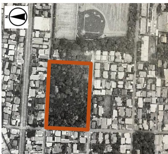
八小建設前の航空写真

私は第二小学校に入学した。児童数が多くなり、パンク寸前だったため、昭和 53 年に第八小学校が新設され、それに伴い兄は4年生、私は2年生で転校することになる(八小では5年生が最高学年で一回生。6年生は)。そこは当時雑木林だった場所で、子どもが減ったら老人ホームにするとの話を聞いていた。プールや体育館を校舎の中に作り、校庭は対角線でやっと 50m走ができる小さな小学校で、運動会で駆け抜けるには校門に要注意だった。その頃、一クラス 45 人位だった記憶があるが、親は 40 人学級を求めて運動していたらしいので、今からは想像もできない。もちろん校歌は無く、小規模小学校は学校行事が多く、全員が知り