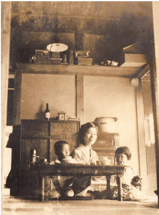
昭和初期の川島家の様子。左端が川島さんのお父様

国立の町もお庭の広い家が少なくなり寂しくなってきましたが、一橋大学をはじめとして学校が多いので、まだ緑の多い町として自慢できます。