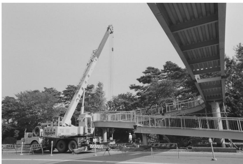
工事中の歩道橋(昭和 45 年)

私も反対派の主張を理解できなくはないが、当面、目の前の子供達の安全を考え母親達と一緒に頑張った。乳母車・車いすも考えて、都内初のスロープ式のスタイルの様式になることも聞いていて嬉しかった。