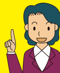
イラスト:「消費者庁イラスト集より」