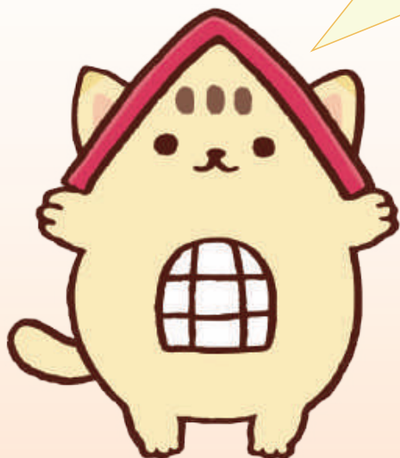
くにニャン