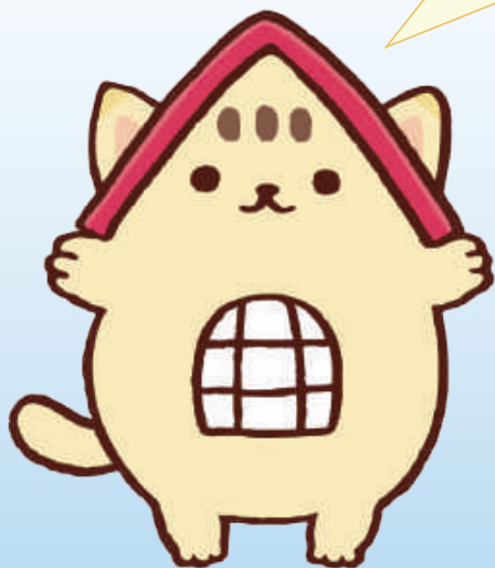
くにニャン