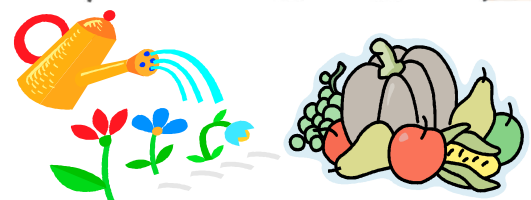
ガーデニングや家庭菜園などで利用