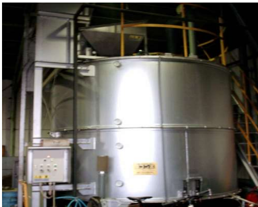
生ごみと木質チップを攪拌・発酵させる