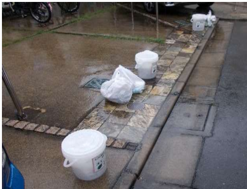
バケツ内のビニール袋のみ収集