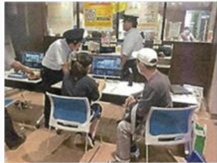
トレインシミュレーター (旧国立駅舎の展示室)