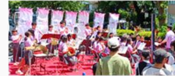
中学・高校生、団体等の演奏やパフォーマンス