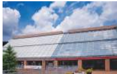
구니타치 시민 예술 소 홀

2015년에 시작한 2년마다 열리는 예술축제. 2015년의 아와 조각전 수상작품 6점이 대학거리에서 전시되어 있습니다.