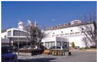
도쿄도 다마 장애인 스포츠 센터

※구내 출입은 전수에서 허가를 받으십시오. 산업계에 많은 리더를 배출해 온 사회학과계 국립대학교법인. 간토대지진으로 피해를 입어 간다에서 구니타치로 이전.