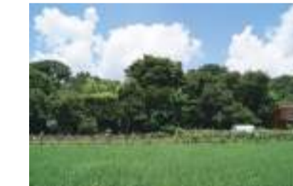
벼농사 체험 논

조야마공원 안에 있는 구니타치의 농업에 관련한 정보발신점. 이벤트나 수확체험 등을 기획하고 시설 대에도 하고 있습니다.