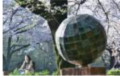
구니타치 아트 비엔날레

매년 봄에 가지가 늘어선 벚꽃이 만드는 아치 풍경은 정말 아름답고 사진 촬영의 인기 스팟 중 하나.