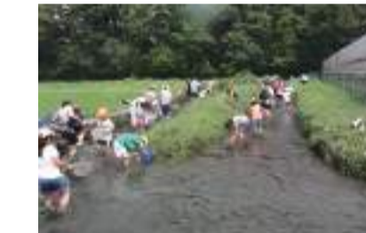
후추용수(농림수산성 : 전국수목식)

중세 호국의 성관 유적. 무사시노의 수목이 많이 남아 있습니다. 4월하순에 남방바람꽃, 8월 하순에 벚꽃을 즐겨 볼 수 있습니다.