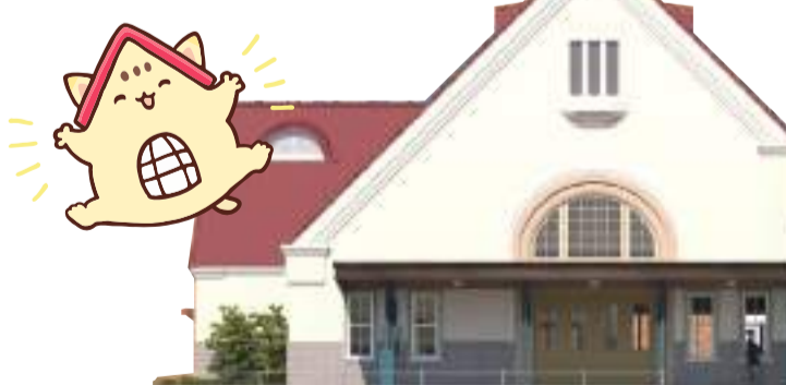
구 구니타치역사란 뭘까?

야보텐만구와 함께 구니타치의 상징 "구 구니타치역사". 개업한 1926년(다이쇼15년)부터 2006년(헤이세이18년)까지 80년간 이 지역의 인구로서 또는 약속 장소로서 시내 사람들 외에도 시외 사람들에게도 사랑받고 있습니다. 도쿄도 내에서는 하라주쿠역사 다음에 오래된 목조역사이며 2006년에는 구니타치시 유형문화재 건조물로 지정되었습니다.