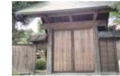
혼다가 야쿠이문(국가 등록 문화재)

각종 자료에 대해 역사나 자연을 디자인한 수건이나 그림엽서, 시내에서 채취된 벌꿀 등도 판매 중. 기념품으로 추천합니다.