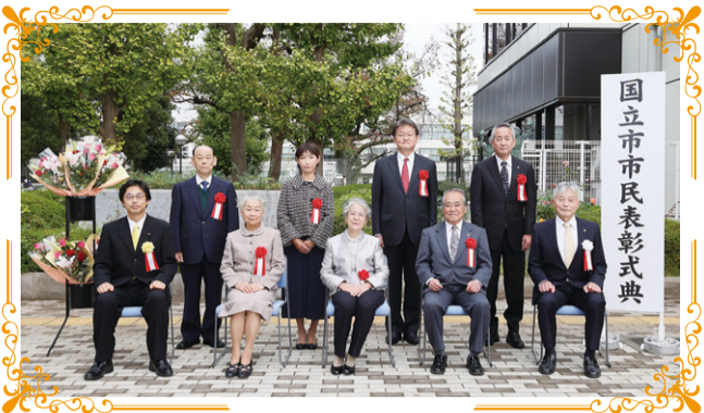
▲11月3日に開催した「令和2年度国立市市民表彰式典」にて撮影。 ※撮影の際、一時的にマスクを外しています。