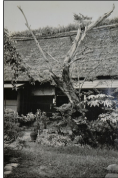
▶昭和38年ごろの旧本田家住宅。

ここで、復元後の活用案やバリアフリー整備に関する、市民の皆さまのご意見を伺うため、意見を聞く会を開催します。ぜひ、ご参加ください。 日時 ①12月17日(木)午後7時～8時30分②20日(日)午後1時30分～3時 場所 市役所3階 第1・2会議室 定員 各回30名(当日先着順) 問生涯学習課社会教育・文化財担当