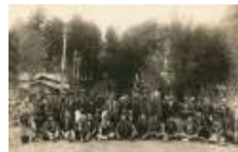
种植樱花树的谷保村青年团国立支部

05 大学道的樱花 [D-2/D-3] 在昭和8年,为了几年皇太子的诞辰,国立町会决定种植樱花树。谷保村青年团国立支部的年轻人帮忙一起看护树苗,培育了一批优秀的樱花树。