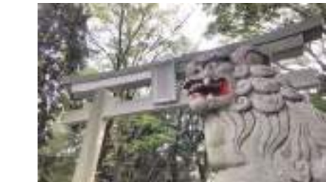
谷保天满宫 国立市谷保 5209 [D-4]

这是东日本最古老的天满宫神社,其中的狛犬等物是国家指定的重要文化财产。在这片安静的树林区域内还有本地雕刻家关敏氏的作品。