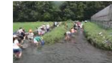
府中灌溉水(农林水产省:全国疏水百选) [B-4]/[C-4 etc.]

这是中世纪贵族城堡的遗迹。这里留下了许多武藏野的树林。每年4月下旬可以观赏鸚草,8月下旬可以观赏日本的狐狸剃刀草。