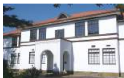
泷乃川学园本馆(国家注册有形文化财产) 国立市谷保 6312 [B-4]

Mama是当地的方言,意思是悬崖线。这里是南部悬崖线下10个滴水处中,水量最大的一个。