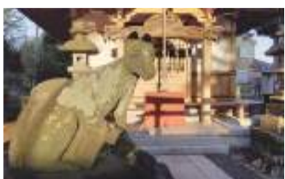
青柳稻荷神社 国立市青柳 236 [A-4]

这里是与立川市接壤的边境处的一小绿洲,有湿地树木、野生鸟类也会在此栖息。绿地内涌出的地下水汇集于向南方流淌的矢川。