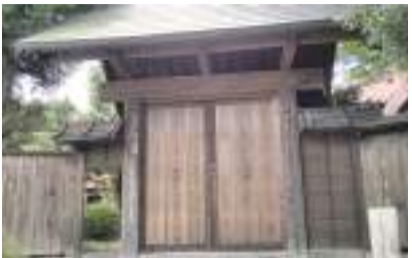
本田家医药门(国家注册文化财产) 国立市谷保 5122 [D-4]

这里除了有各种资料外,还出售具有历史和自然特色的手巾和明信片,另有本市所产的蜂蜜,供您作为礼物之选。