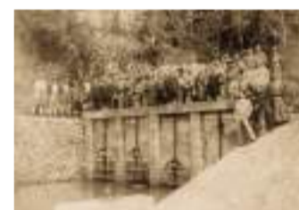
08 府中灌溉水 [B-4/C-4 etc.]

据“Anne的日记”的记载,这是由于思念 Anne Frank 而被培育出来的新品种玫瑰。其父亲 Otto Frank 曾将此花赠与日本,被作为和平都市宣言的纪念而栽培。