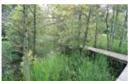
矢川绿地(东京都指定保护地域) 立川市羽衣町 3 丁目 [A-3]/[B-3]

为了让残疾人随时可以感受体育的乐趣,在这里设有泳池、体育馆等设施,并举办各类教程。此外还有人可以参与的夏日祭等活动。