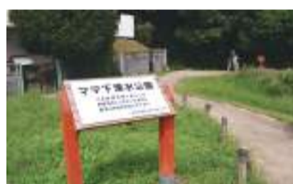
Mama 下滴水公园 国立市矢川 3-12 [B-4]

这是市内的艺术关联设施,包括可以容纳336人的大厅和可以容纳70人的工作室,此外还有音乐练习室、画廊等。它的隔壁是综合体育馆。