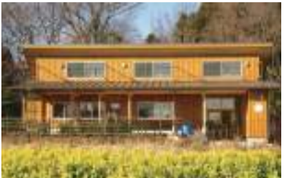
城山之家 [C-4] 国立市泉 5-21-20 ☎042-505-5190

自江户初期以来,本田家族几代人中陆续诞生了多位书法家 and 医生。以这个门的高度,即使骑着马也可以通过。(内部通常不对外开放)。