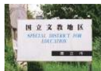
06 指定的文教地区 [D-1]

04 一桥大学兼松讲堂 [D-2] 由独特的建筑师伊东忠太所建成的罗马风格的讲堂内,有无处不在的各种奇特装饰。这里还会举办音乐会和公开讲座,深受市民欢迎。