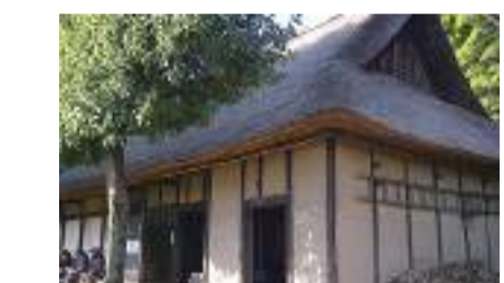
国立市旧民居(市指定文化财产) [C-4] 国立市泉 5-21-20 ☎042-575-3300

这是一座收集了当地的历史、民族、美术、自然等相关资料的博物馆。这是一个远离喧嚣,令人心情放松的场所。此外,还会不定期举办展览。