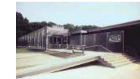
国立乡土文化馆 [B-4] 国立市谷保 6231 ☎042-576-0211

在夏季,流经农田的水像鱼网一般,形成一个宝贵的生态环境。在这里,会有小鱼,还会有稀有昆虫。