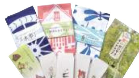
乡土文化馆的商品

在城山公园内,有搬迁过来的江户时代的茅草屋顶的民居。屋内展示着壁炉和土间等过去人们生活所用之物。