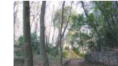
城山公园(东京都历史环境保护区) 国立市谷保 1700 [C-4]

这是东日本最古老的天满宫神社,其中的狛犬等物是国家指定的重要文化财产。在这片安静的树林区域内还有本地雕刻家关敏氏的作品。