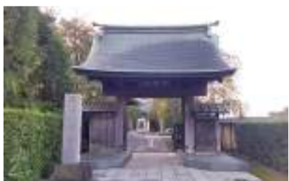
南养寺 国立市谷保 6218 [B-4]

保护这片地域的稻荷神社的守护神是一只石狐。每年会举行1月的祈福火会,2月的初午、8月的盆踊、9月的例行大祭等活动。