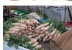
12月の某日、朝7時まえ