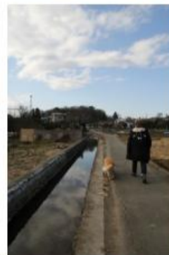
そこに水がミタされる冬