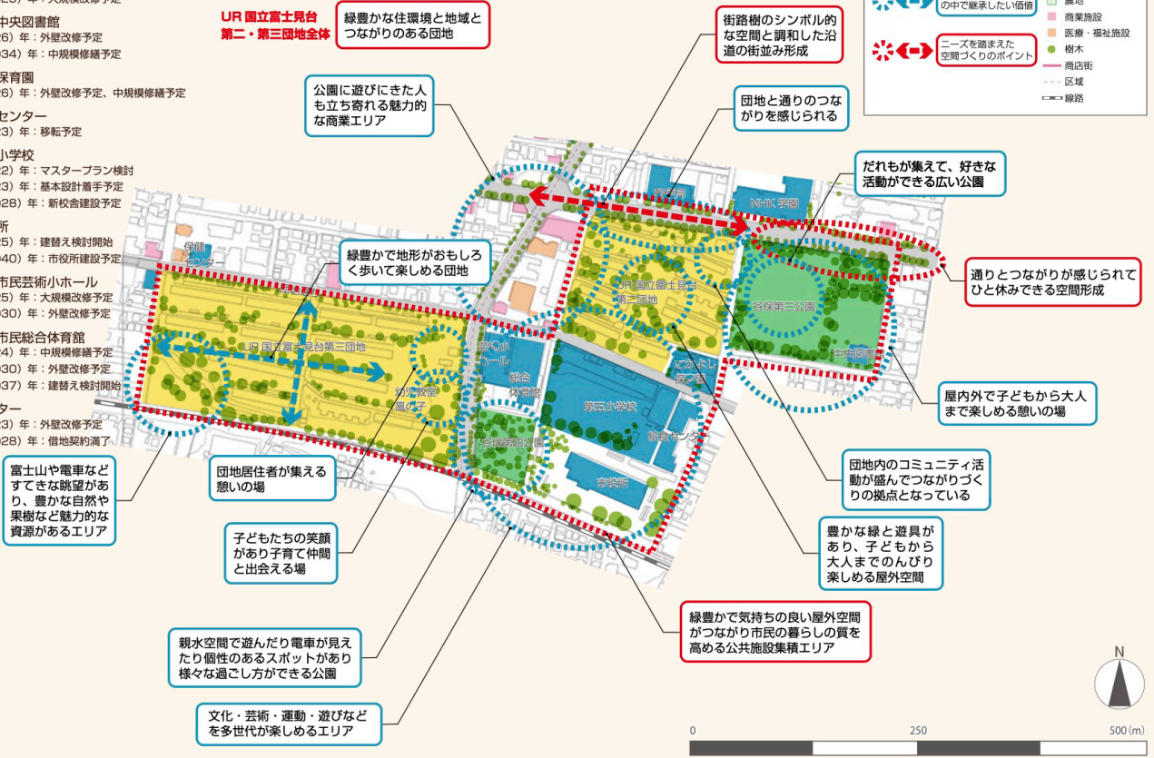
国立市富士見台地域重点まちづくり構想より（令和 3 年） 105

これまでの富士見台ミーティングの取組等の詳細については、ホームページをご覧ください。