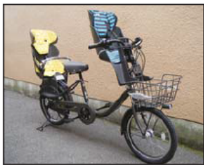
▲実際の貸し出し自転車と同じ型のものです。

期間 1年間(年度)申請により更新可能。 ※貸し出し期間中の事故や盗難、パンク等の修理、更新時および返却時の点検費用