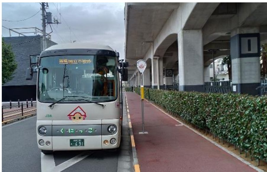
写真1 高架下駐輪場前停留所